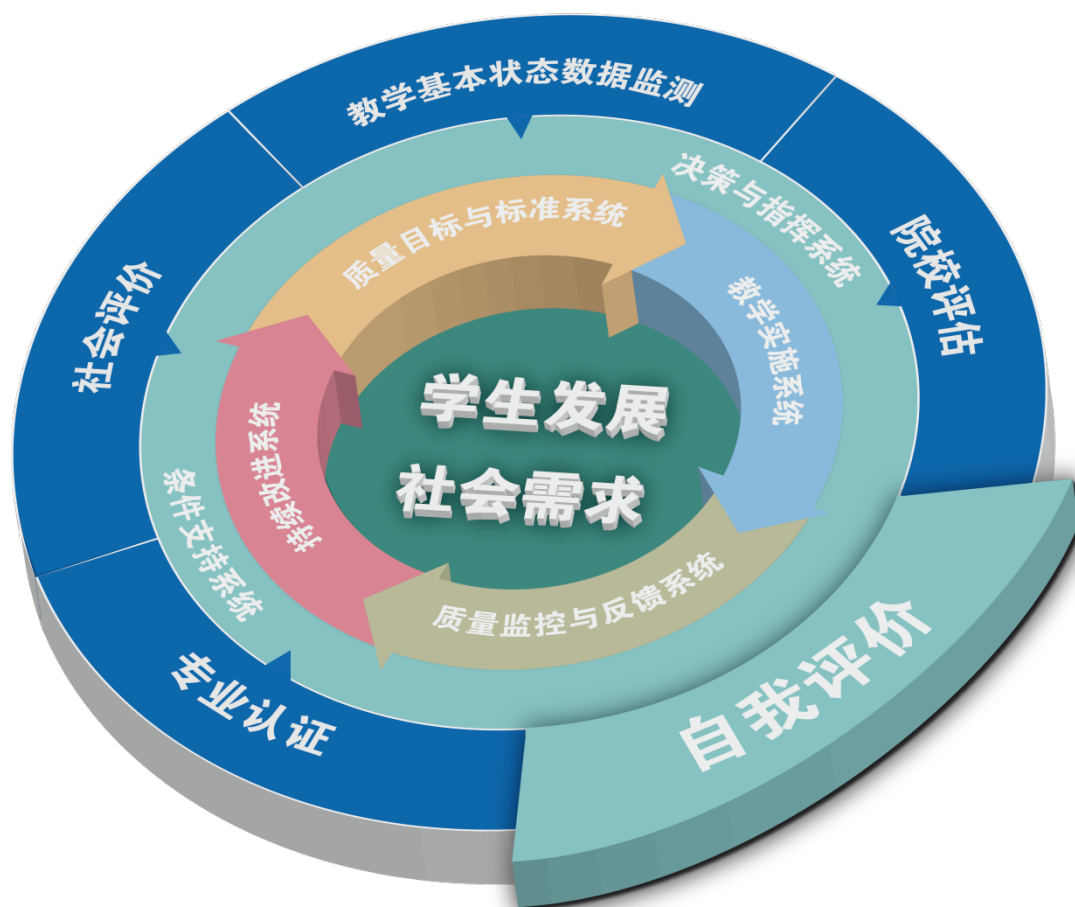
云南中医药大学教育质量保障体系图